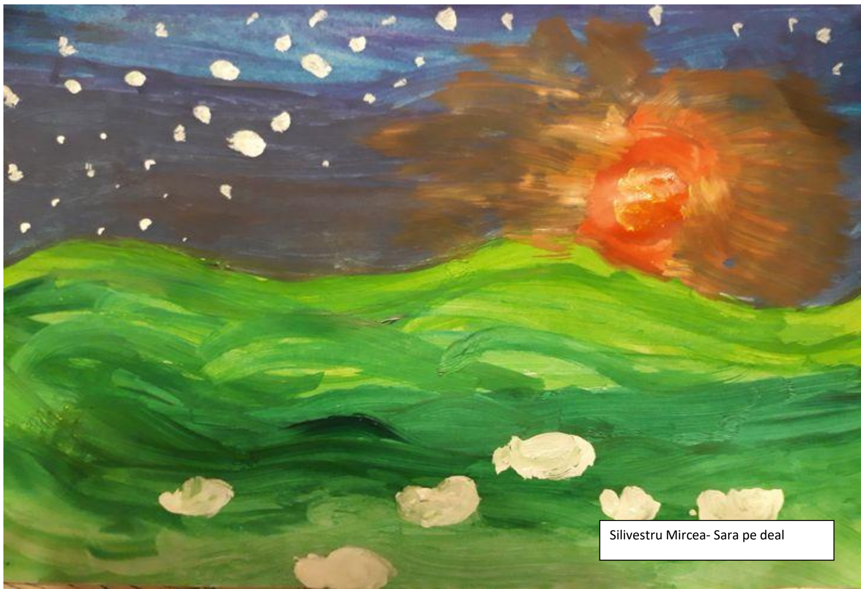
Silvestru Mircea- Sara pe deal